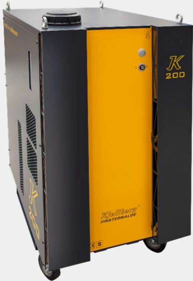
Plasmavirtalähde K 200