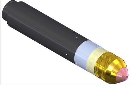
Konepoltin K-Torch kiinteä