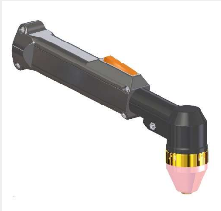
Käsiopoltin K-Torch M