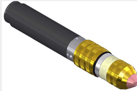
Konepoltin K-Torch pikavaihtopää